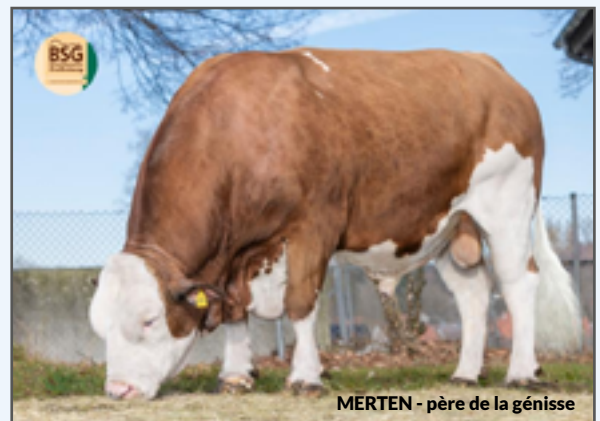
MERTEN - père de la génisse