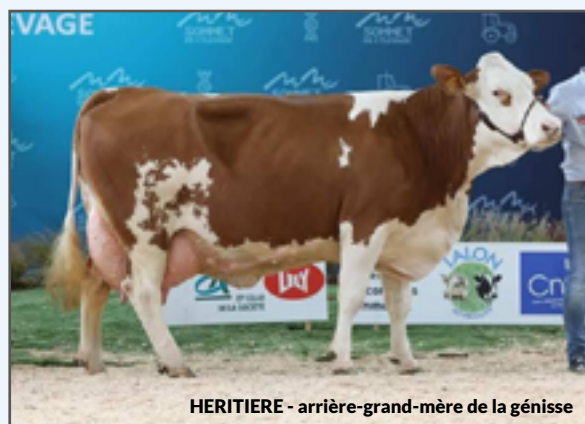
HERITIÈRE - arrière-grand-mère de la génisse