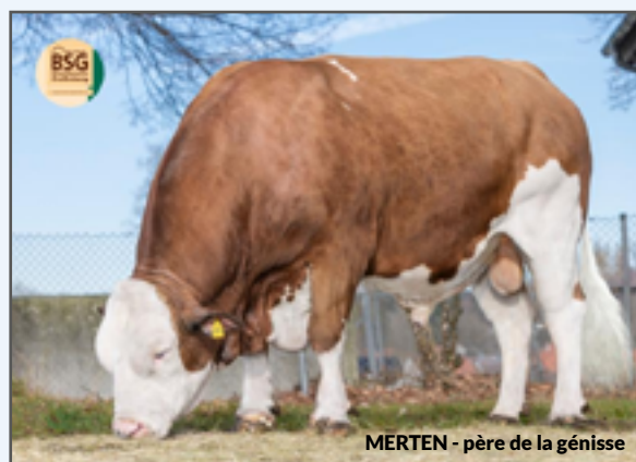
MERTEN - père de la génisse