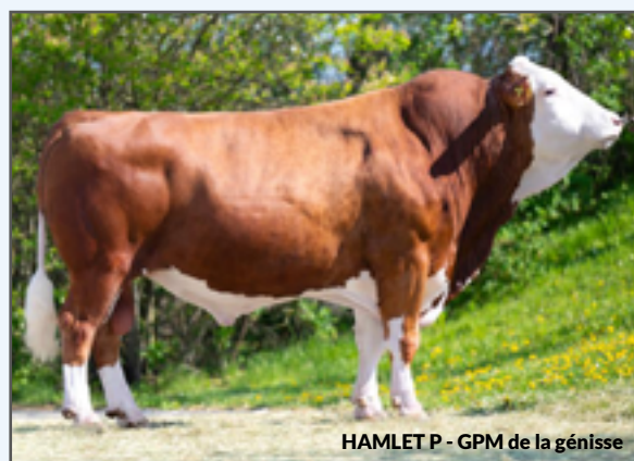
HAMLET P - GPM de la génisse